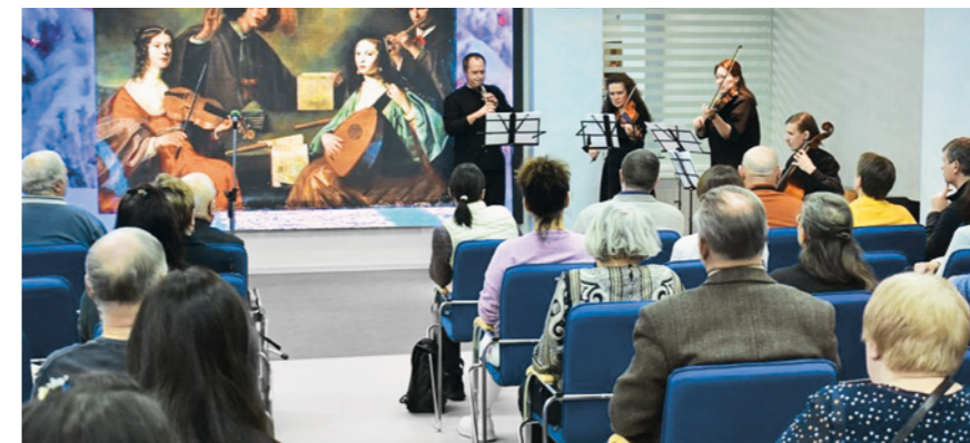
Ансамбль Cantus Benedictus

Счастье – это так легко! День без драм, потерь, тревог.