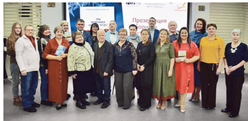
Авторы сборника «Три морозных месяца чудес»