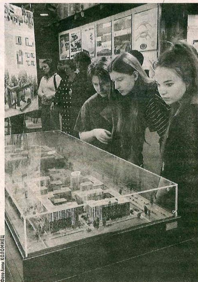
Выставка раскрывает феномен

Сотрудники учреждения приглашают всех желающих окунуться в историю построек конца 1950-х годов до начала 2000-х годов, изучить строительную документацию, а также познако-